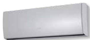
ASYG 9 et 12 LT

L'UNITÉ INTÉRIEURE, SA TÉLÉCOMMANDE ET L'UNITÉ EXTÉRIEURE