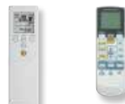
Infra-rouge (série) Infra-rouge (série) (Modèles LMC) (Modèles LFC)