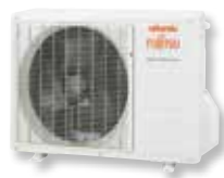
ASYG 7 et 9 LUC ASYG 12 et 14 LU