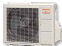
ASYG 7 à 12 LLCC